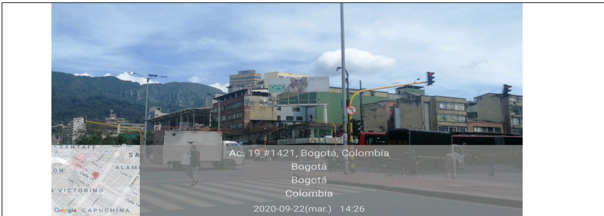
Foto 1. Vista panorámica del predio y de la valla ubicada en la Carrera 14 No 18 - 56 (dirección catastral), orientación Norte-Sur.